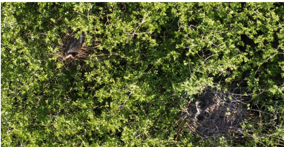
21 mei 2025 Broedende Purperreiger in een vestiging van de Blauwe Reiger in wilgen. Boezem van Brakel (C. van Tuijl).

Bovendien bleek de Purperreiger na jaren van afwezigheid ook weer te broeden in de Boezem van Brakel : dronen gaf 1 nest tussen de Blauwe Reigers te zien (C. van Tuijl).