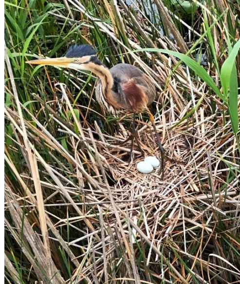
Wat een vogel! (D. Prop)

Waarom er in 2025 meer Purperreigers wat zuidelijker in ons land tot broeden zijn gekomen en in hoeverre lokale omstandigheden hierbij een rol gespeeld hebben, is niet te zeggen. Een ding kan met grote waarschijnlijkheid gezegd worden: aan de broedresultaten van de kolonies ligt het niet.